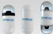
PillCam™ Capsule Endoscopy Platform